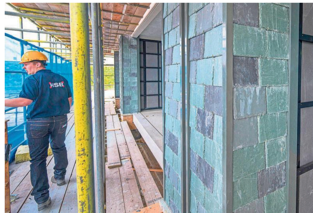
De buitenmuren zijn met leesteen bekleed.

boven alles uit. In het noorden ligt de Waarderpolder, met hier bijna recht beneden station Spaarnwoude als nagenoeg persoonlijke overhalte voor de toekomstige bewoners. En aan de oostkant ligt een uniek stukje groen, ook al direct voor de deur: het is het archeologische rijksmonument op de oudste strandwal, waarin de sporen van de alleroudste bewoning in dit gebied