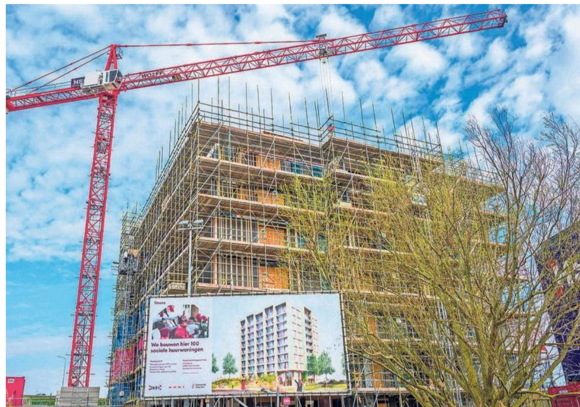
Zes van de tien verdiepingen staan inmiddels op elkaar.